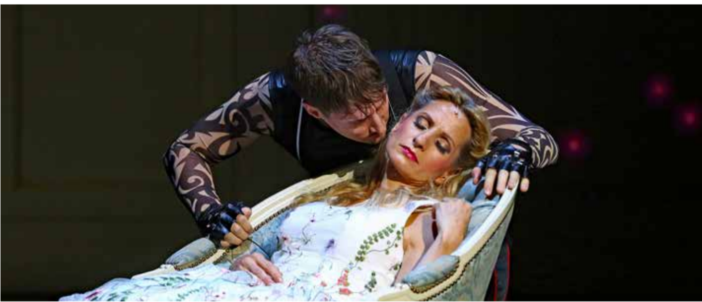
Am Freitag ist Premiere der Staufer Festspiele.

Neben der Operninszenierung der Zauberflöte für Erwachsene, wird es eine spezielle, vollwertige Kinderfassung des Stückes geben. Dabei ist den Machern bei der Besetzung des Erzählers und des Papageno ein echter Coup gelungen. Der bekannte Showmaster und langjährige Tigerenten-Moderator, Malte Arkona, konnte für diese Produktion gewonnen werden. Die Staufer Festspiele erwarten bei Veranstaltung rund 40 Schulklassen aus dem Landkreis Göppingen. www.staufer-festspiele.de