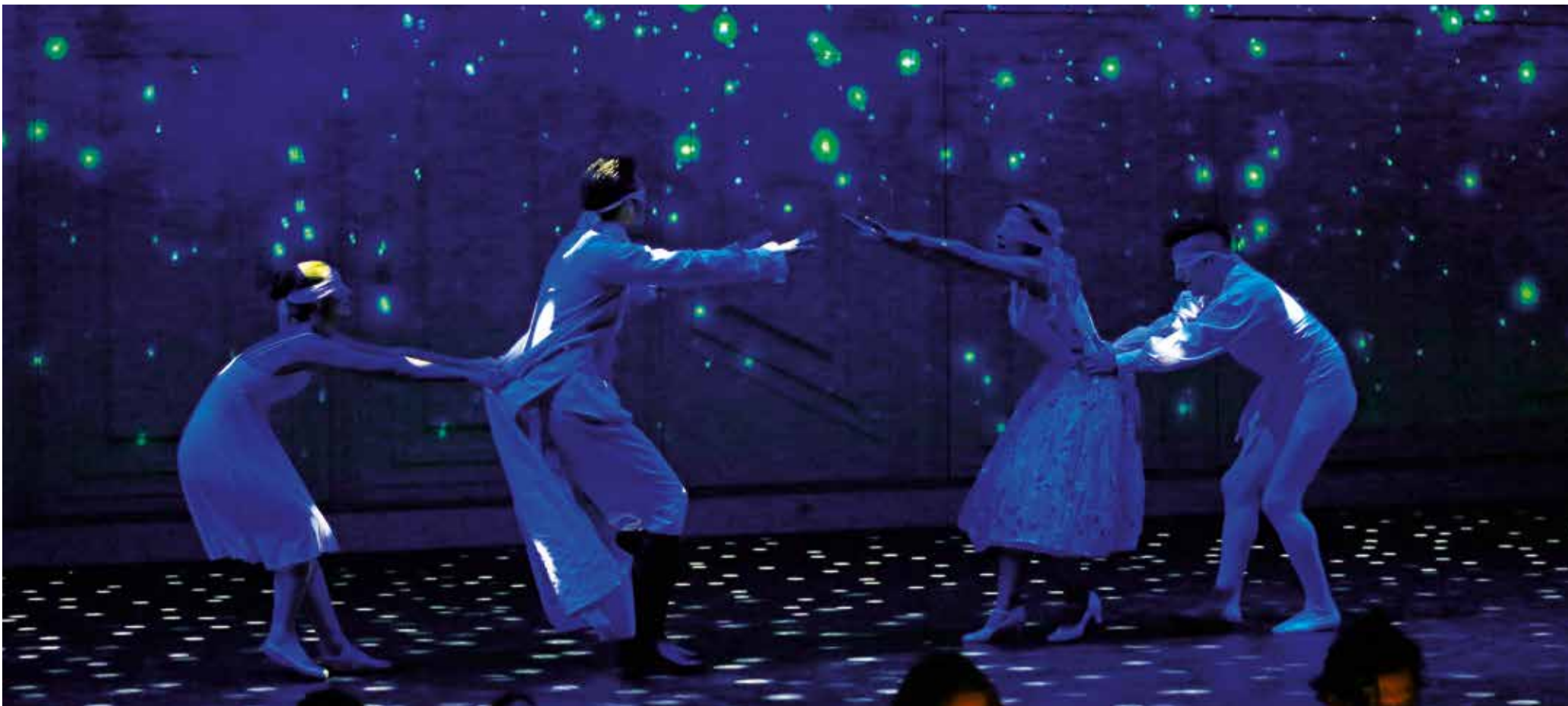
Die Staufer Festspiele bringen in diesem Jahr „Die Zauberflöte“ von Mozart auf die Bühne.